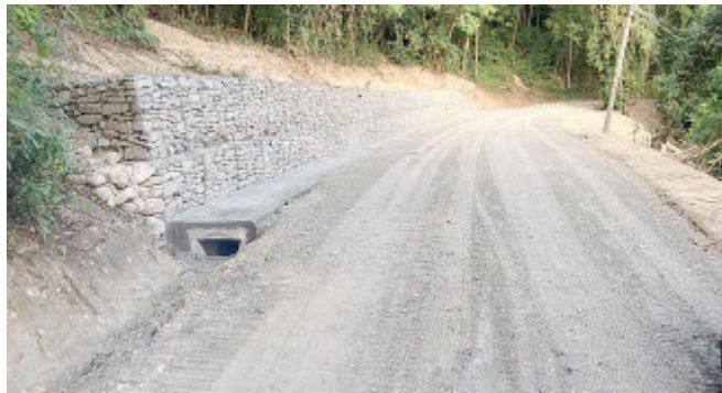
INTERVENTO CONCLUSO Via della Cagliara a Torre.

Conclusi i lavori in via della Cagliara dove la scarpata a valle aveva ceduto in seguito alle abbondanti piogge